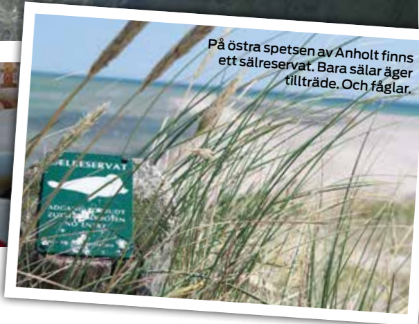
På östra spetsen av Anholt finns ett sälreservat. Bara sälar äger tillträde. Och fåglar.

inte så svårt; vänta in rätt väder, ta ut rättvisande kurs över öppet hav och styr kosan mot Anholt. Från Falkenberg eller Varberg är det cirka 30 sjömil, från Göteborg cirka 60 sjömil.