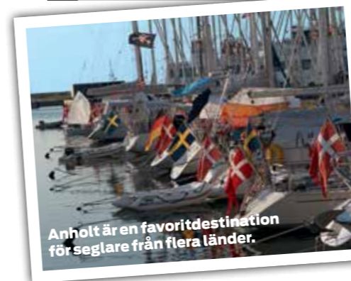
Anholt är en favoritdestination för seglare från flera länder.

Hamnavgift: 150–250 kronor beroende på båt längd. El tillkommer.