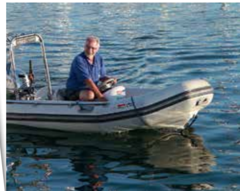
Anholts hjälpsamme hamnkaptan.

platserna är inte obegränsade. Skulle det vara helt fullt går det dock ankra upp i den yttre delen av hamnen och avvakta tills andra besökare ger sig av.