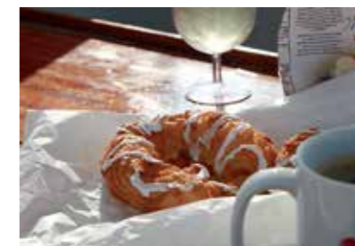
Svensk frukost på danskt vis. Flingor och mjölk, C-vitamin, kaffe och nybakade danska wienerbröd. Bättre än så här blir det inte!