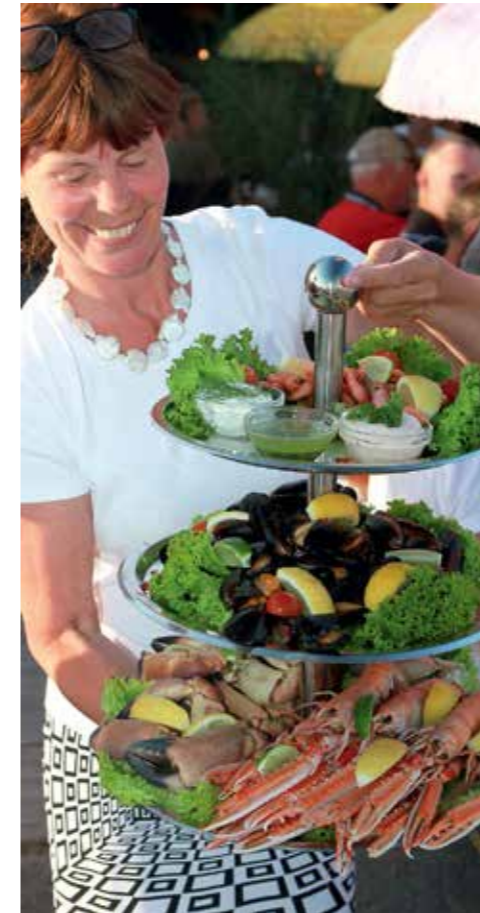
En av restaurangerna i hamnen heter Havhek-sen (havshäxan). Det är självaste ägarinnan, här i färd att servera en av krogens kulinariska specialiteter, som kallar sig så.

Den norra halvan av hamnen är reserverad åt Grenåfärjan, räddningsbåten och ykesfiskarna, och härifrån bör du hålla dig