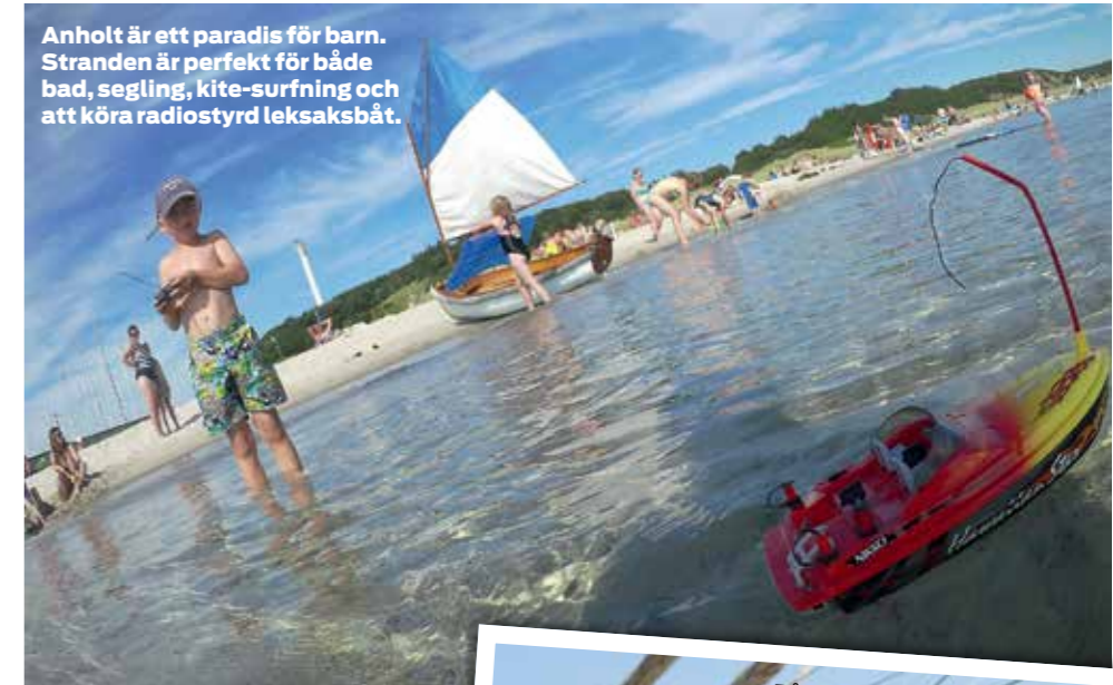
Anholt är ett paradys för barn. Stranden är perfekt för både bad, segling, kite-surfning och att köra radiostyrd leksaksbåt.

Hur tar man sig då hit med egen båt? Det är