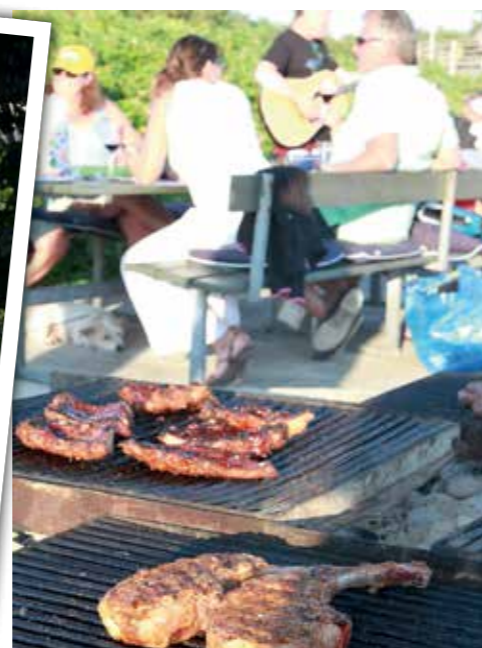
Hamnpersonalen håller med glödande kol till alla varje kväll under högsäsong – ofta bjuds även på inhemsk trubadurunderhållning.